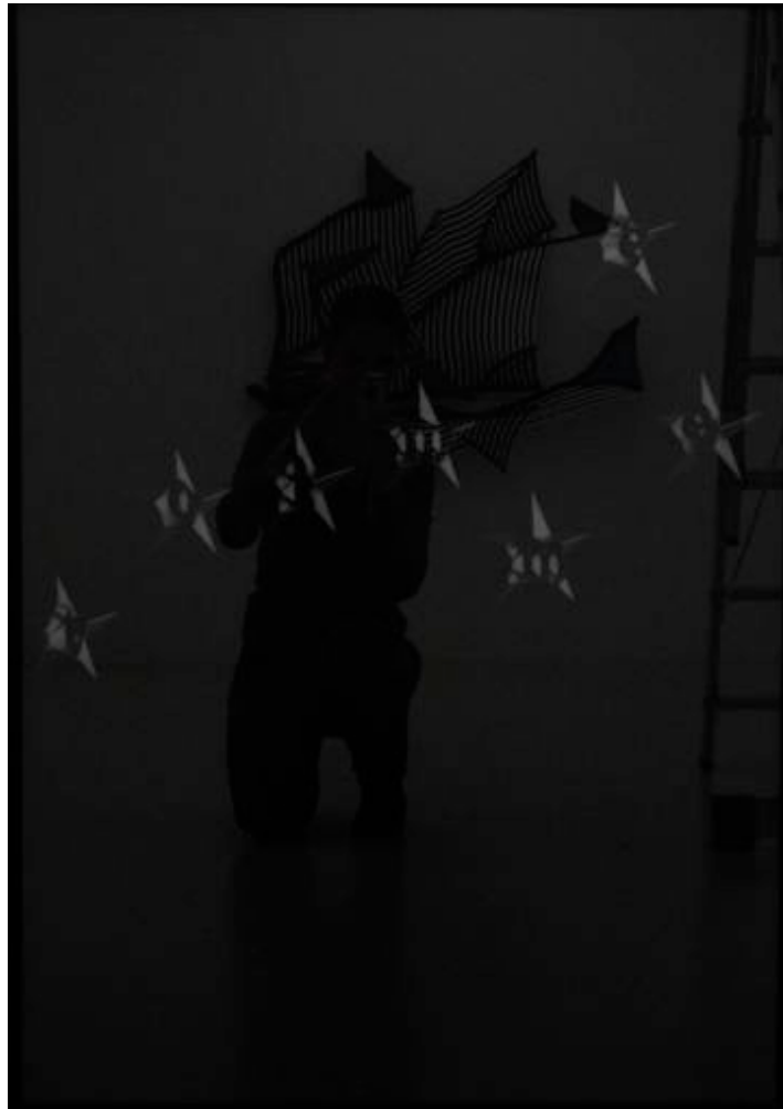
«Toi même», 2005 white pencil on black paper 103,5 x 73 cm, unique, framed