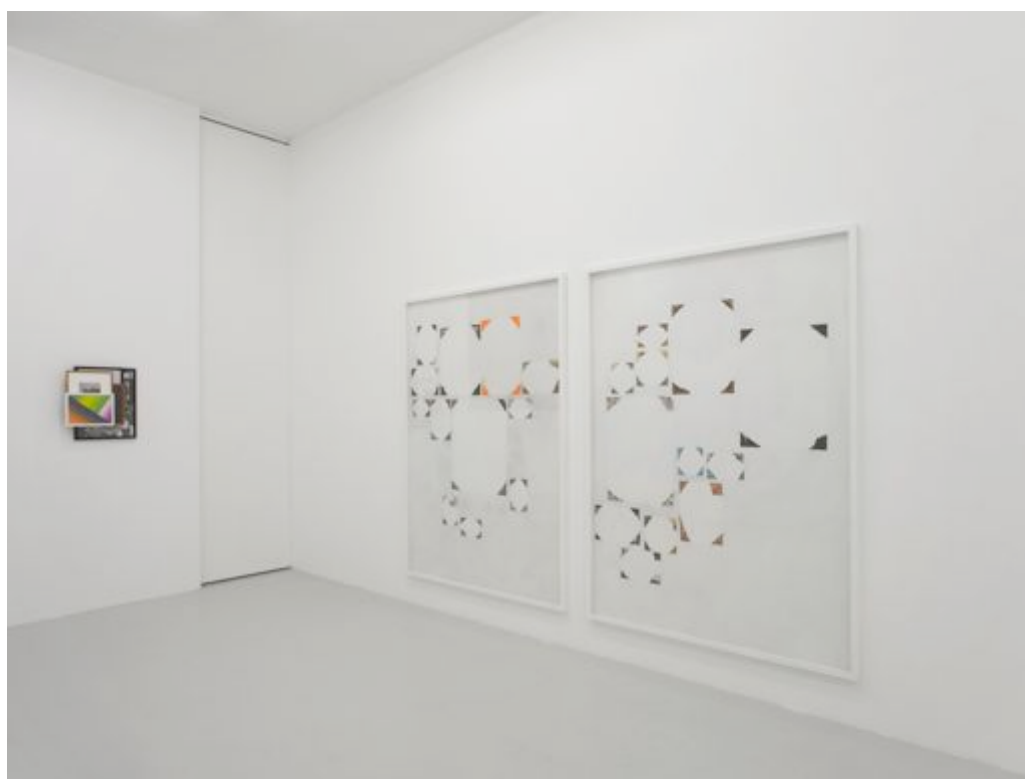
Francisco da Mata – Modern Exhibition views, 2010 Galerie Lange + Pult