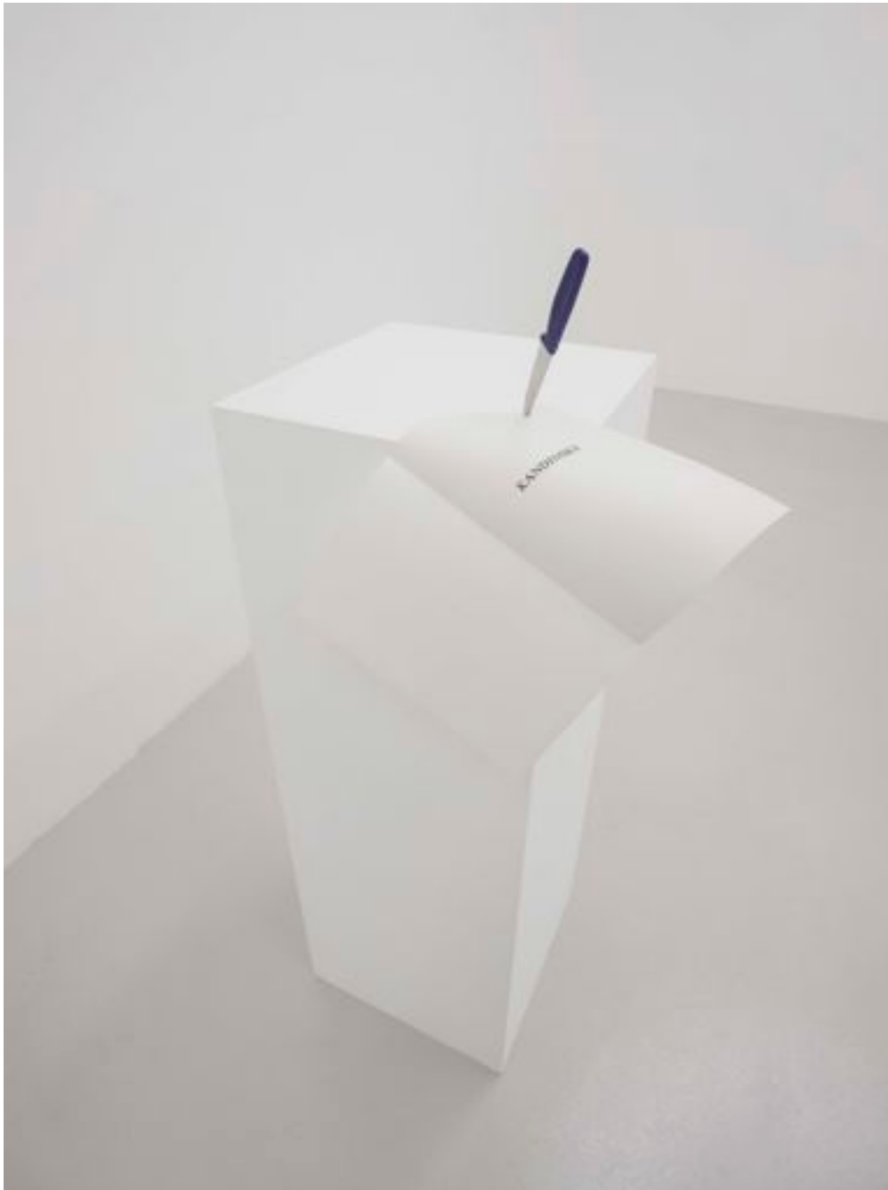
«KANDINSKY WAS HERE!», 2010 knife and book page on stand 134,5 x 49 x 58,5 cm, unique