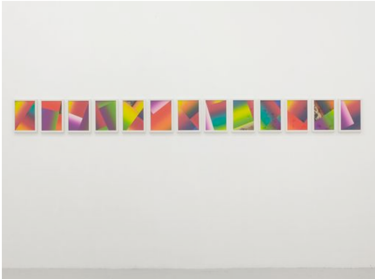
«Sunset composition I-XIII», 2010 paper collage each 29,7 x 21 cm, unique, framed