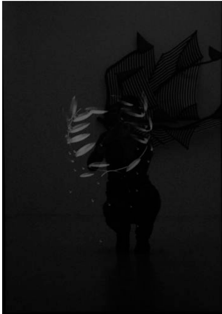
«Laurier», 2005 white pencil on black paper 103,5 x 73 cm, unique, framed