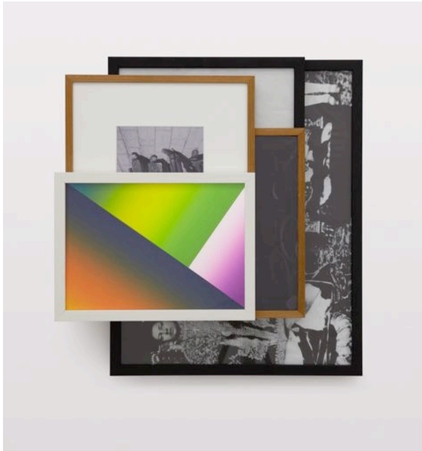
«Moleskine Boogie-woogie», 2009 poster, paper collage, acrylic, c-print and frames 52,5 x 50,5 x 9,7 cm, unique