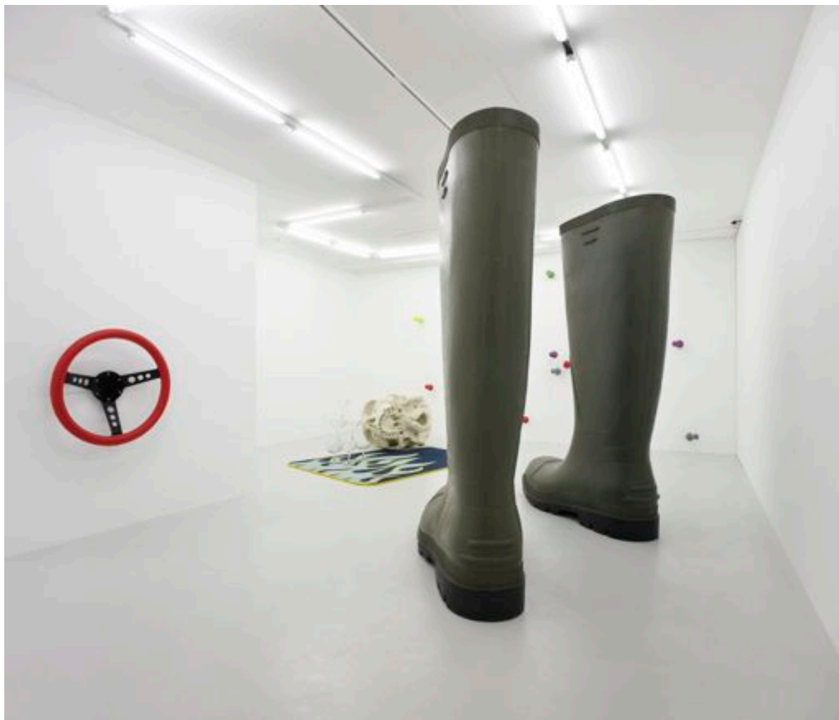
Lilian Bourgeat exhibition view, 2010 Galerie Lange + Pult