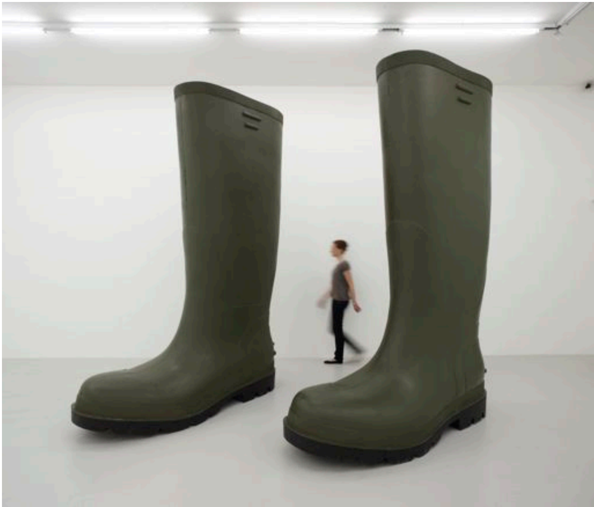
Invendu-Bottes, 2009 polyester resin in 2 parts, each 300 x 200 x 80 cm, ed. of 5