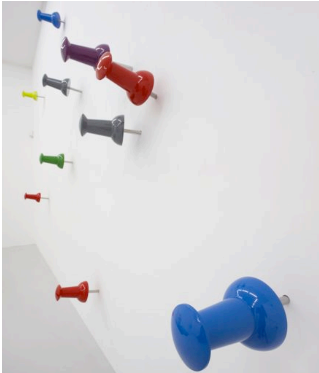
Push pins, 2010 inox, pvc and polyurethane paint 15 pieces, each 40 x 15 x 15 cm, ed. of 3 5 pieces, each 40 x 15 x 15 cm, ed. of 5