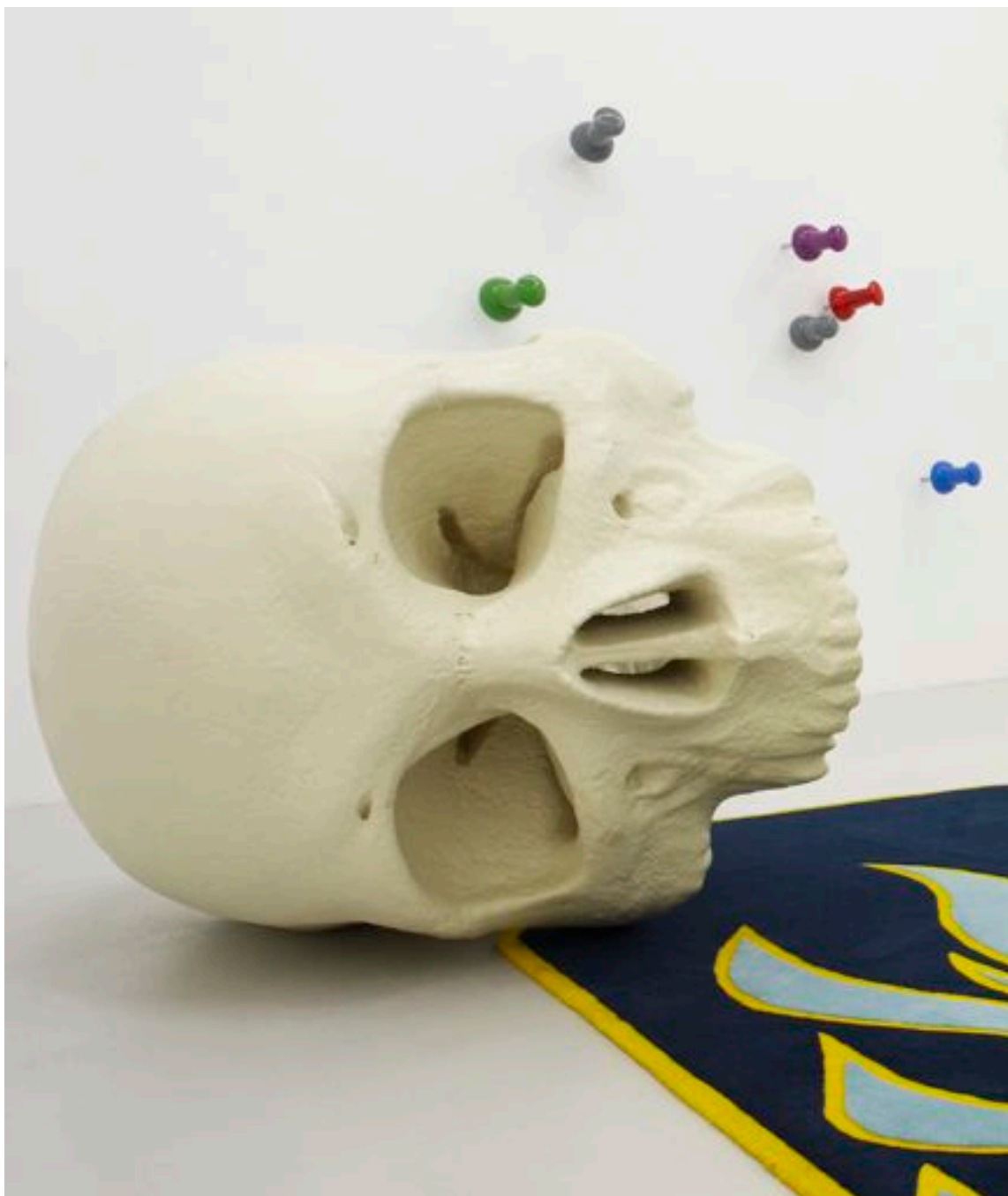
Crâne, 2010 polyester resin 110 x 150 x 100 cm, ed. of 3