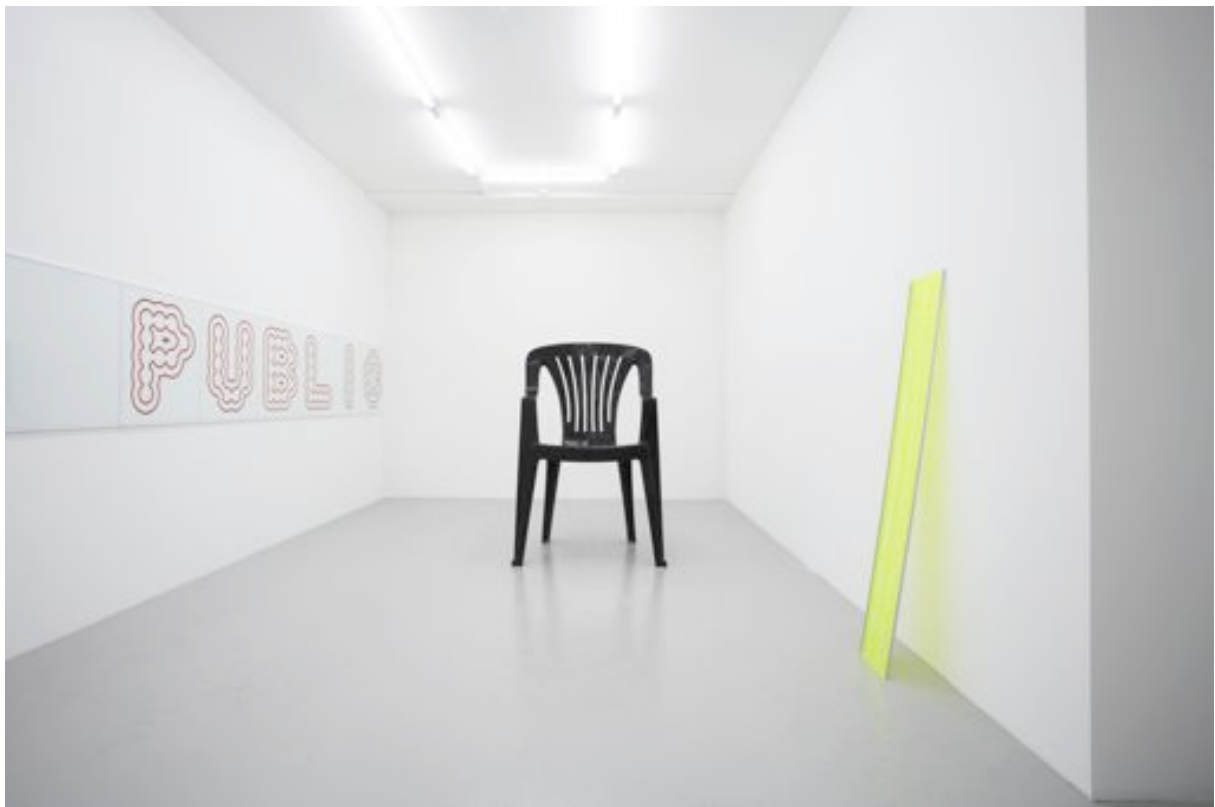
Exhibition view Grand Public Galerie Lange & Pult