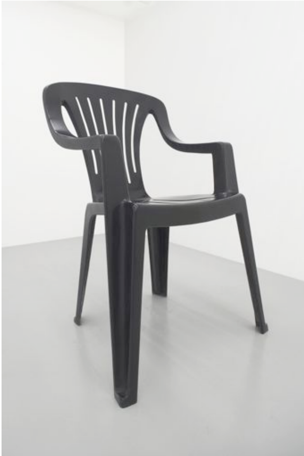
Chaise 2008 Polyester resin 196 x 125 x 115 cm, unique