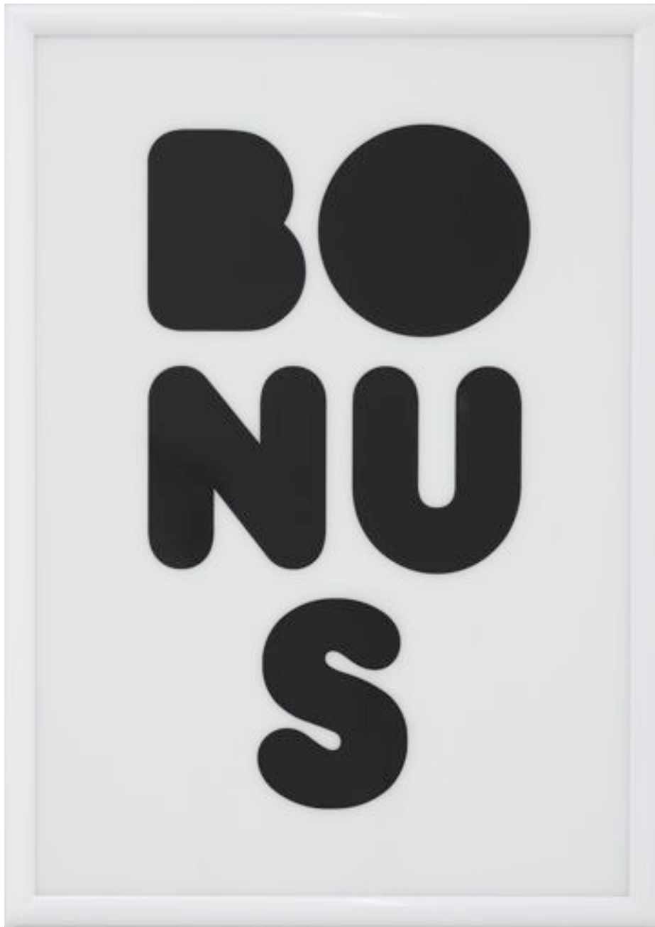
Untitled 2008 Glass, metal, sticker 100 x 70 cm