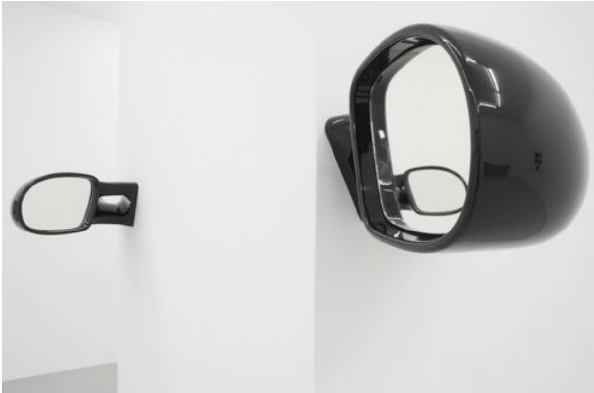
Rétroviseurs (left and right) 2008 Plexiglass Each: 70 x 65 x 40 cm