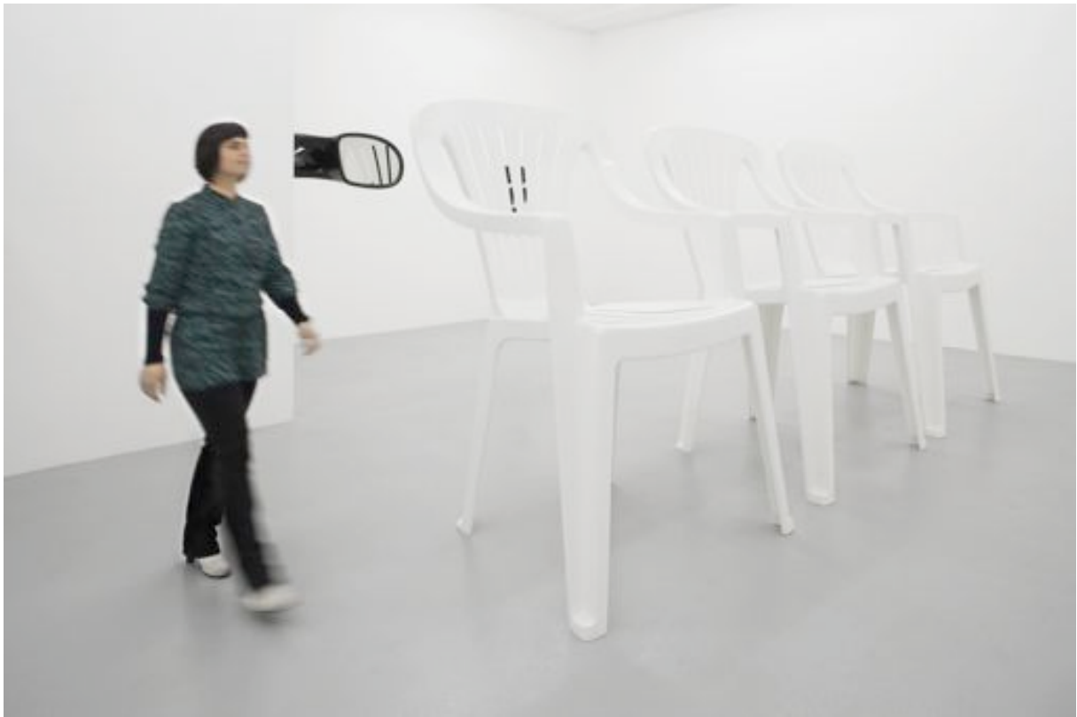
Chaises 2008, Polyester resin 196 x 125 x 115 cm, ed. of 10