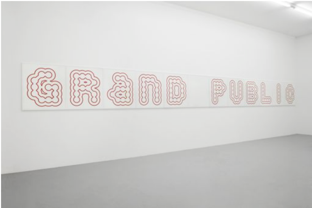
Puffy Dreamland 2008 Glass, metal, sticker 180 x 480 cm