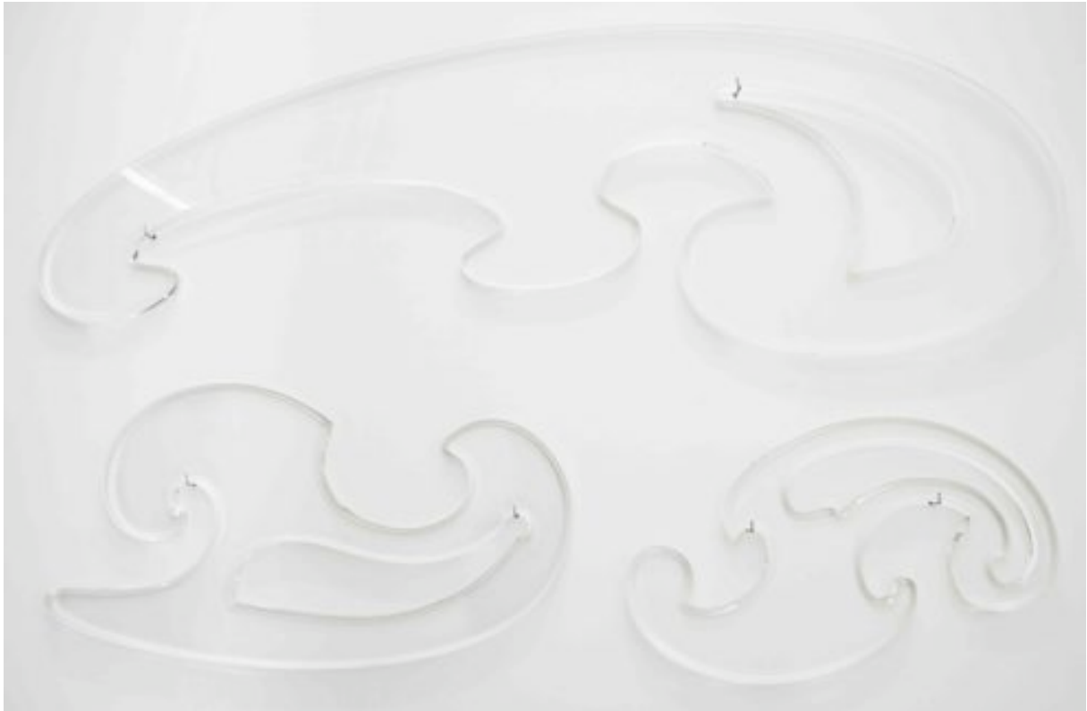
Perroquet 2008 Plexiglass 48 x 146 cm, 40 x 77 cm and 36 x 61 cm; ed. of 3