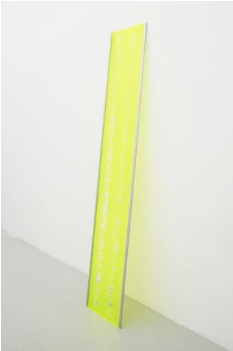
Trace Letters 2008 Plexiglass 200 x 70 cm, ed. of 3