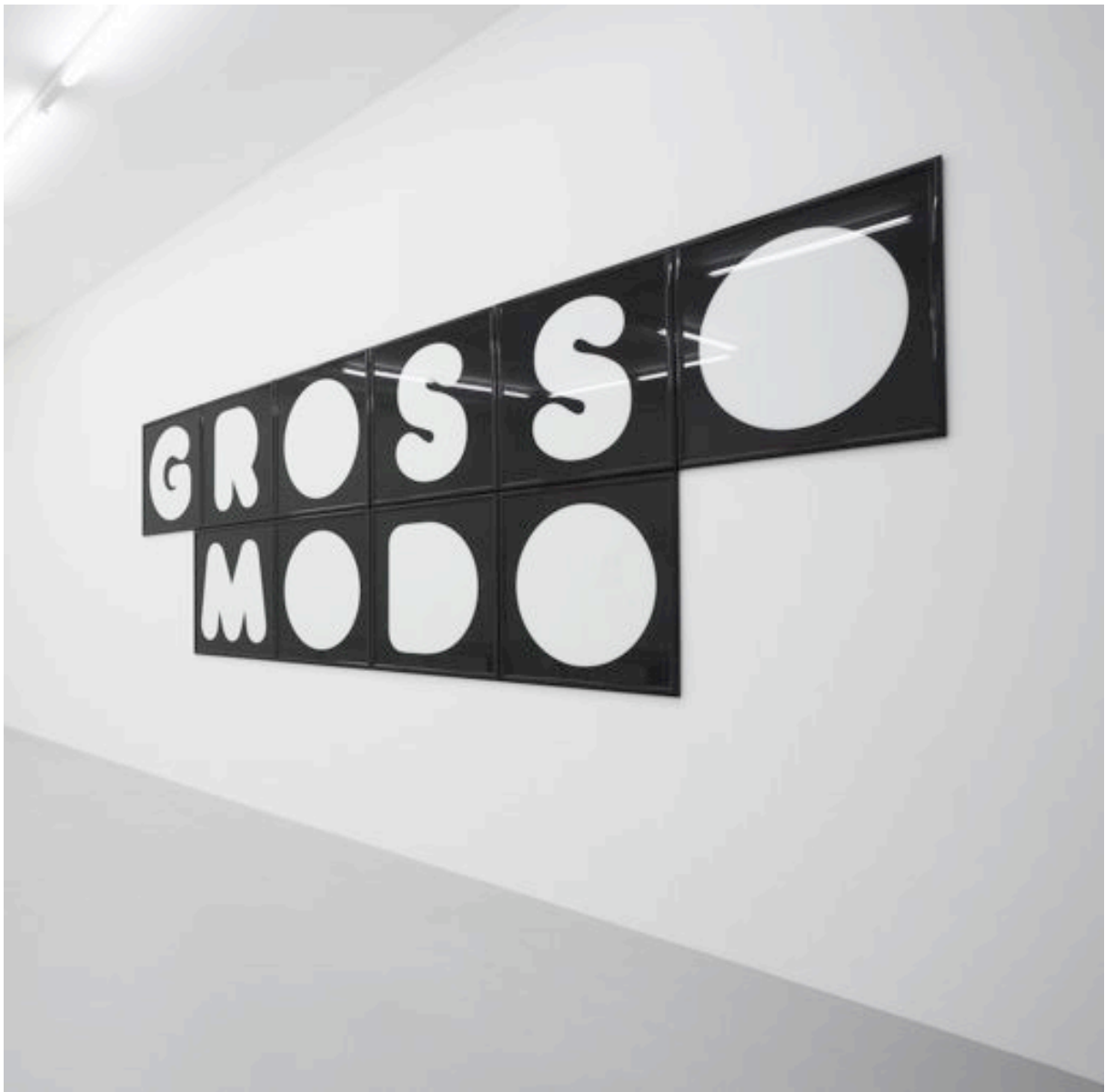
Baruta Black 2008 glass, metal, sticker 160 x 480 cm