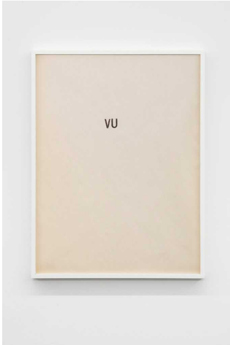
Untitled, 2018 pen on paper 58 × 43,5 cm