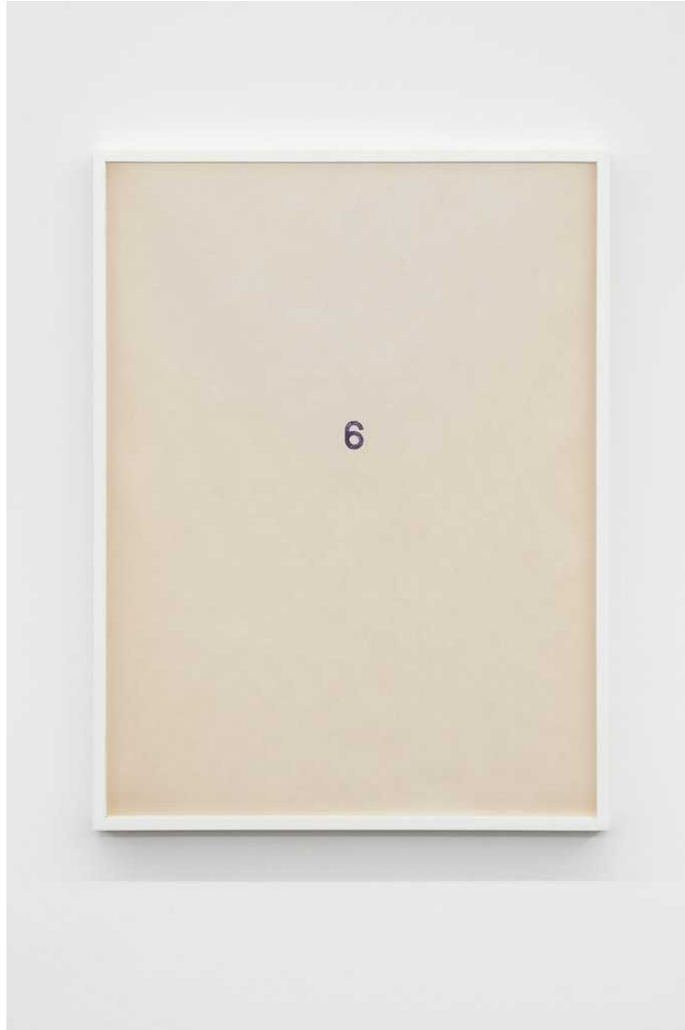
Untitled, 2018 pen on paper 58 × 43,5 cm