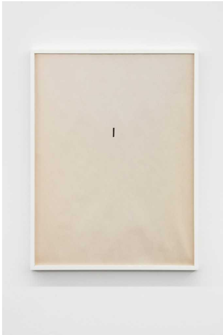
Untitled, 2018 pen on paper 58 × 43,5 cm