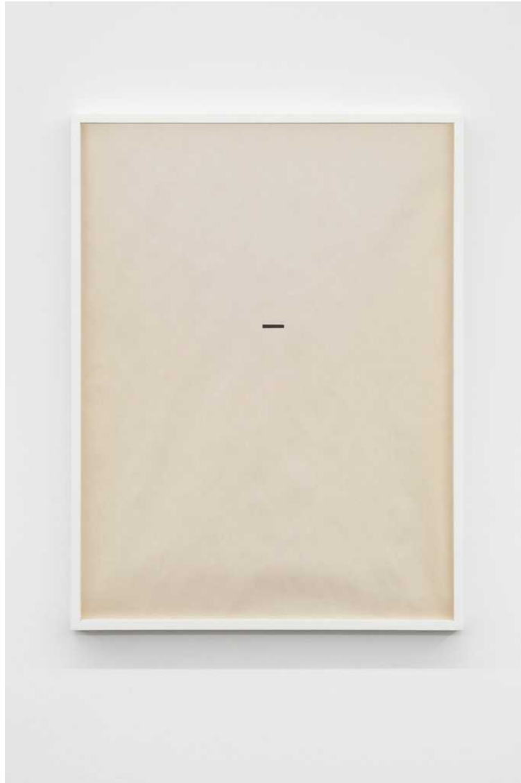
Untitled, 2018 pen on paper 58 × 43,5 cm