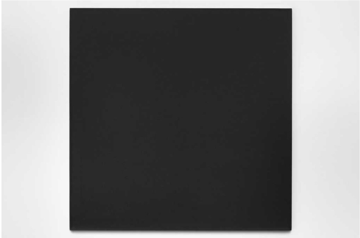
Untitled, 2019 acrylic on canvas 122 × 122 cm