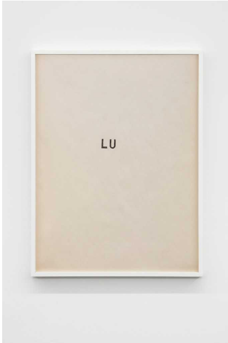
Untitled, 2018 pen on paper 58 × 43,5 cm