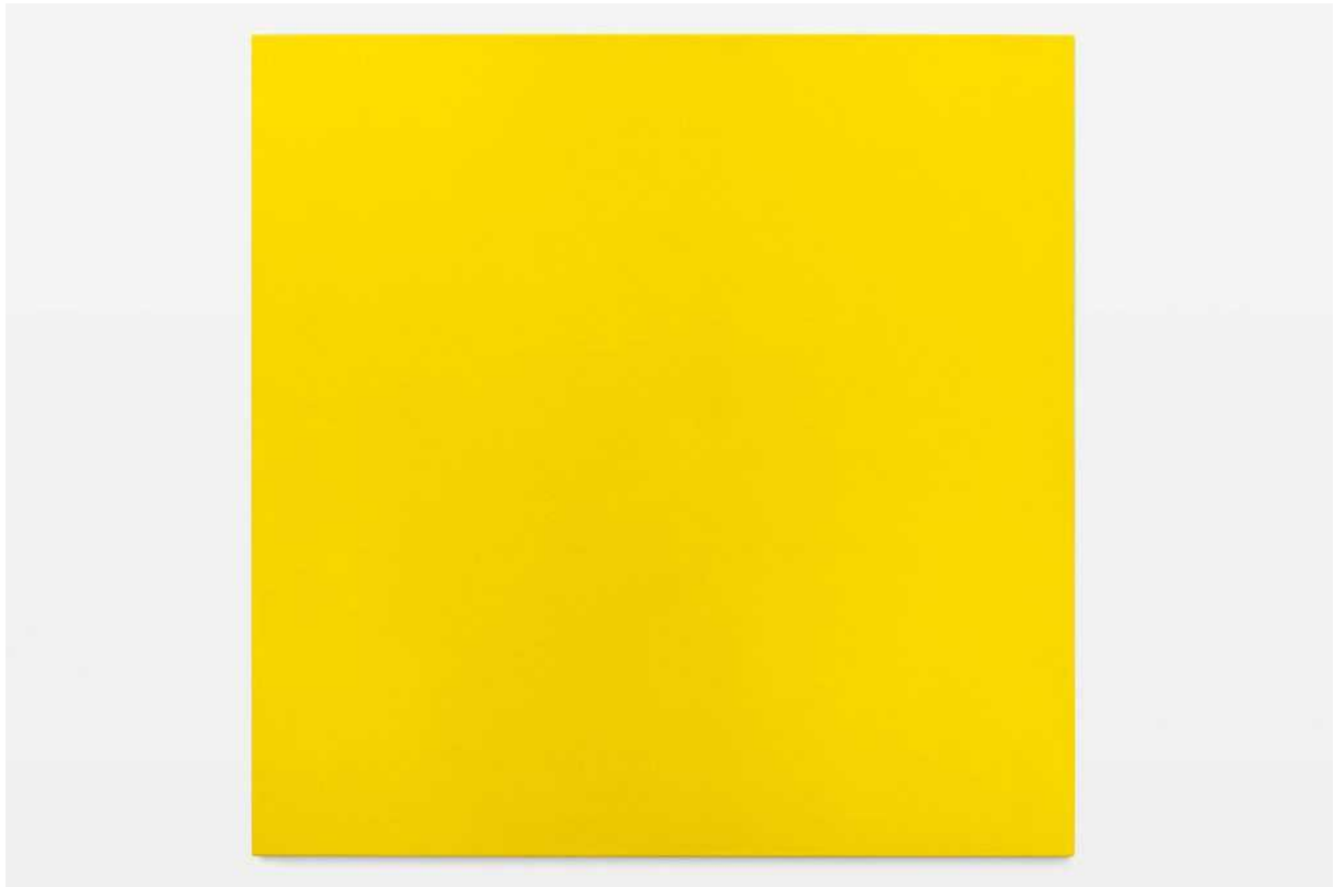
Untitled, 2008 acrylic on canvas 122 × 122 cm