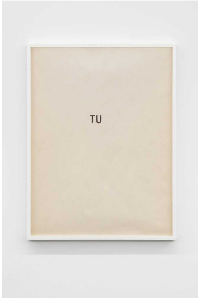
Untitled, 2018 pen on paper 58 × 43,5 cm