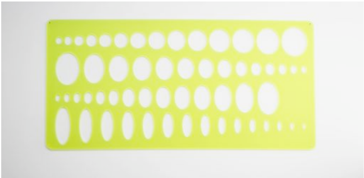
Trace cercles 2008 Plexiglass 97 x 220 cm, ed. of 3