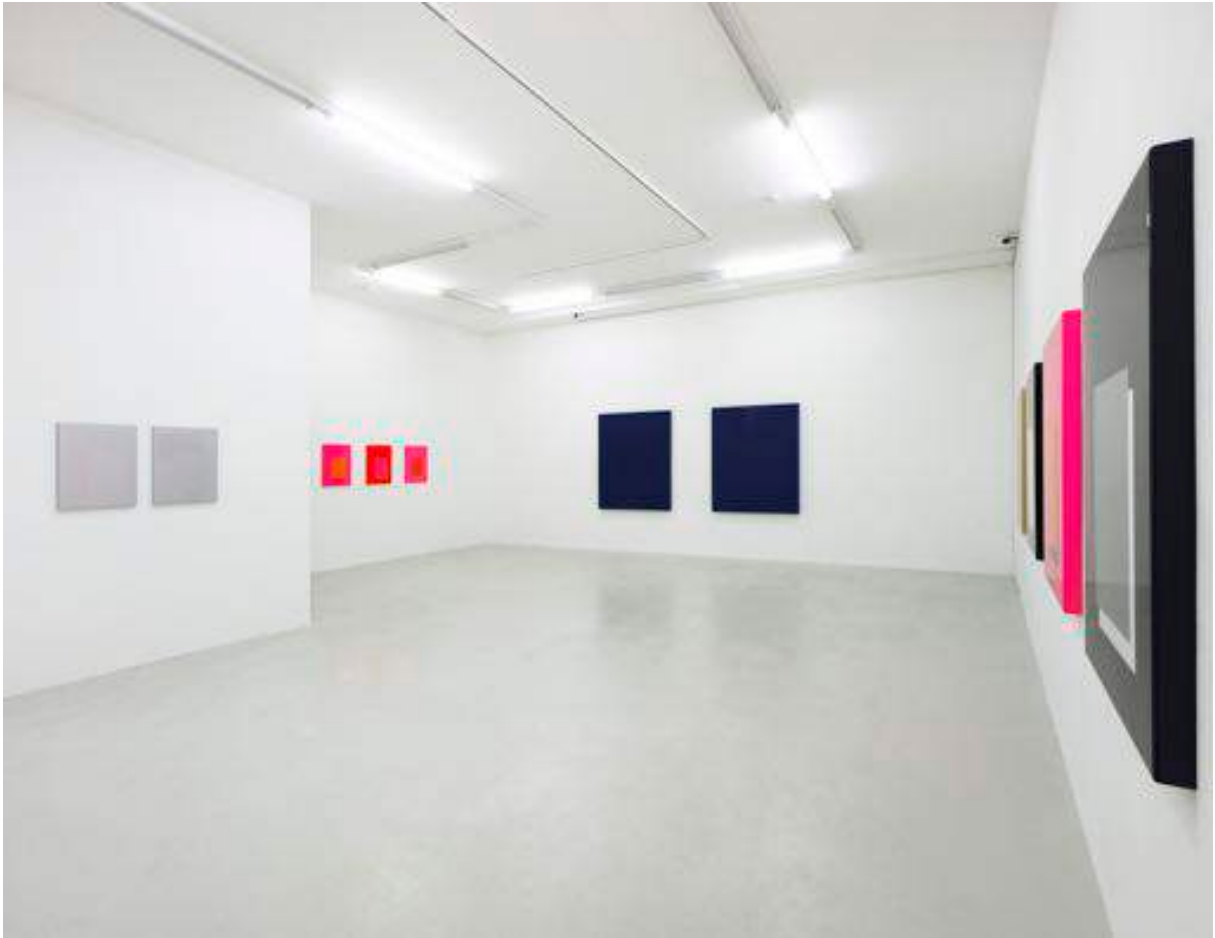
Gerold Miller. reset Exhibition view Galerie Lange + Pult