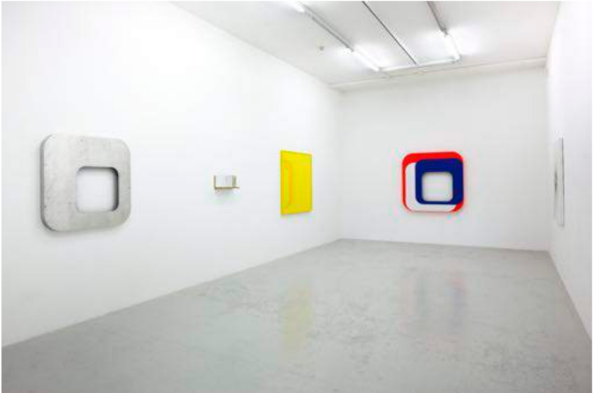
Gerold Miller. reset Exhibition view Galerie Lange + Pult