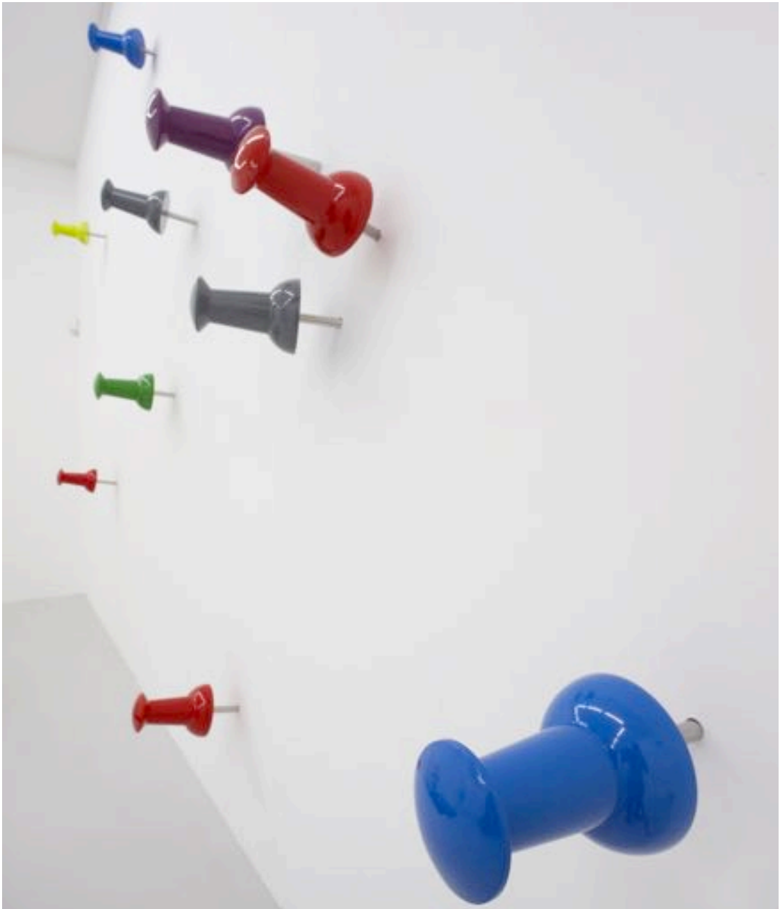
Push pins, 2010 inox, pvc and polyurethane paint 15 pieces, each 40 x 15 x 15 cm, ed. of 3 5 pieces, each 40 x 15 x 15 cm, ed. of 5