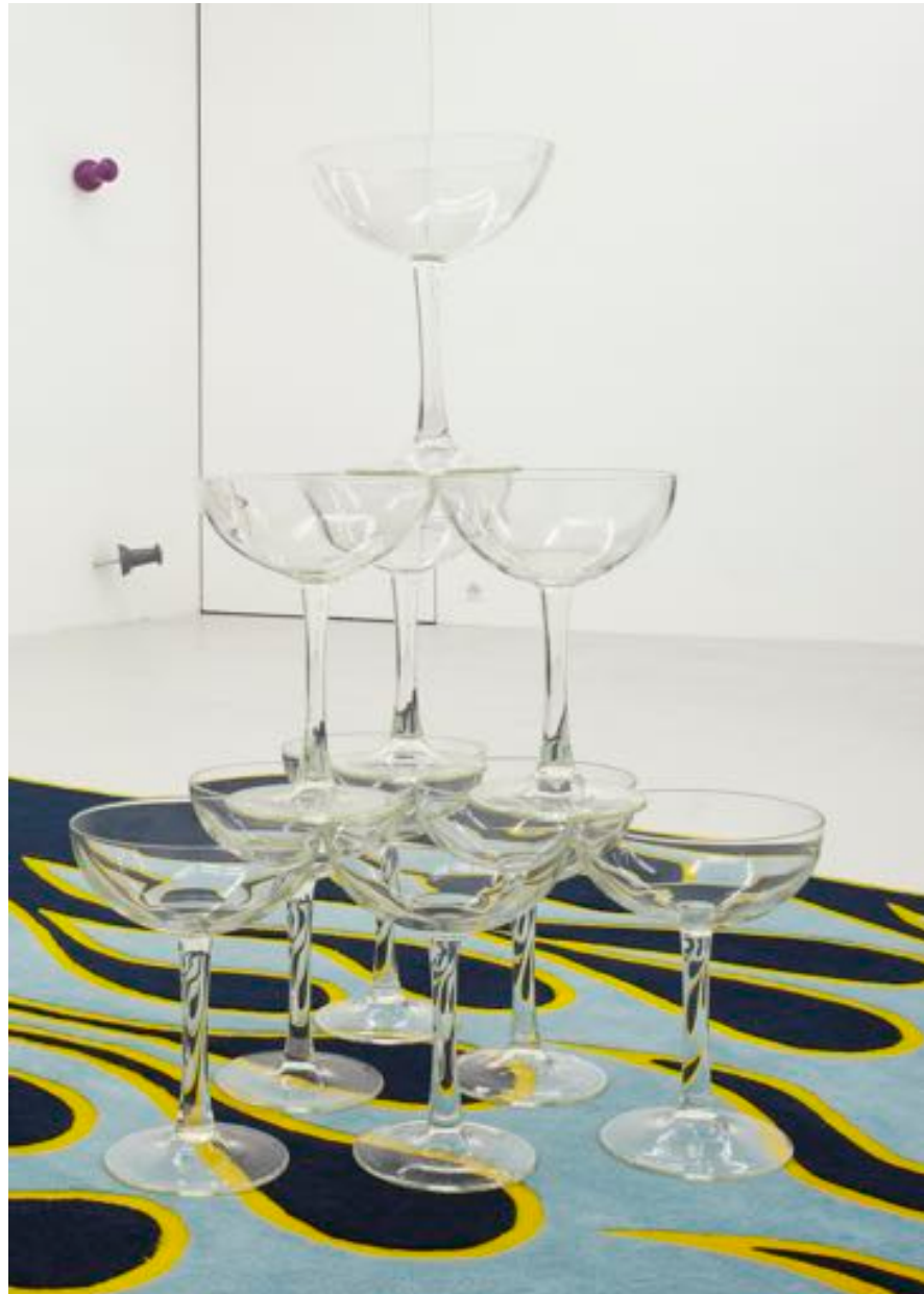
Verres, 2007 glass in 10 parts, each 30 x 15 x 15 cm, ed. of 3