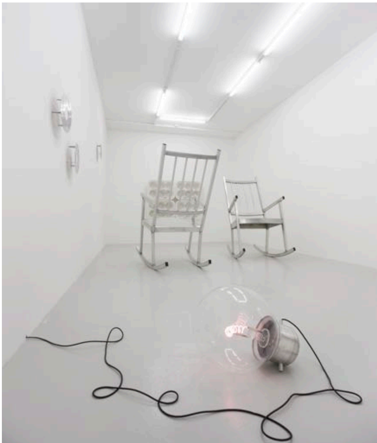
Lilian Bourgeat exhibition view, 2010 Galerie Lange + Pult