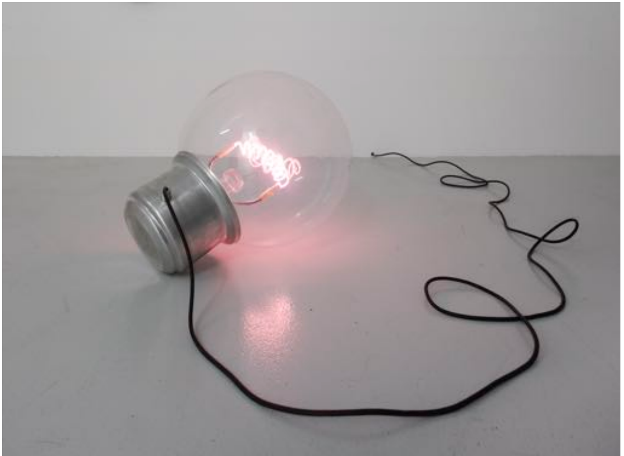
Ampoule, 2007 glass, neon light, aluminium 40 x 40 x 60 cm, unique