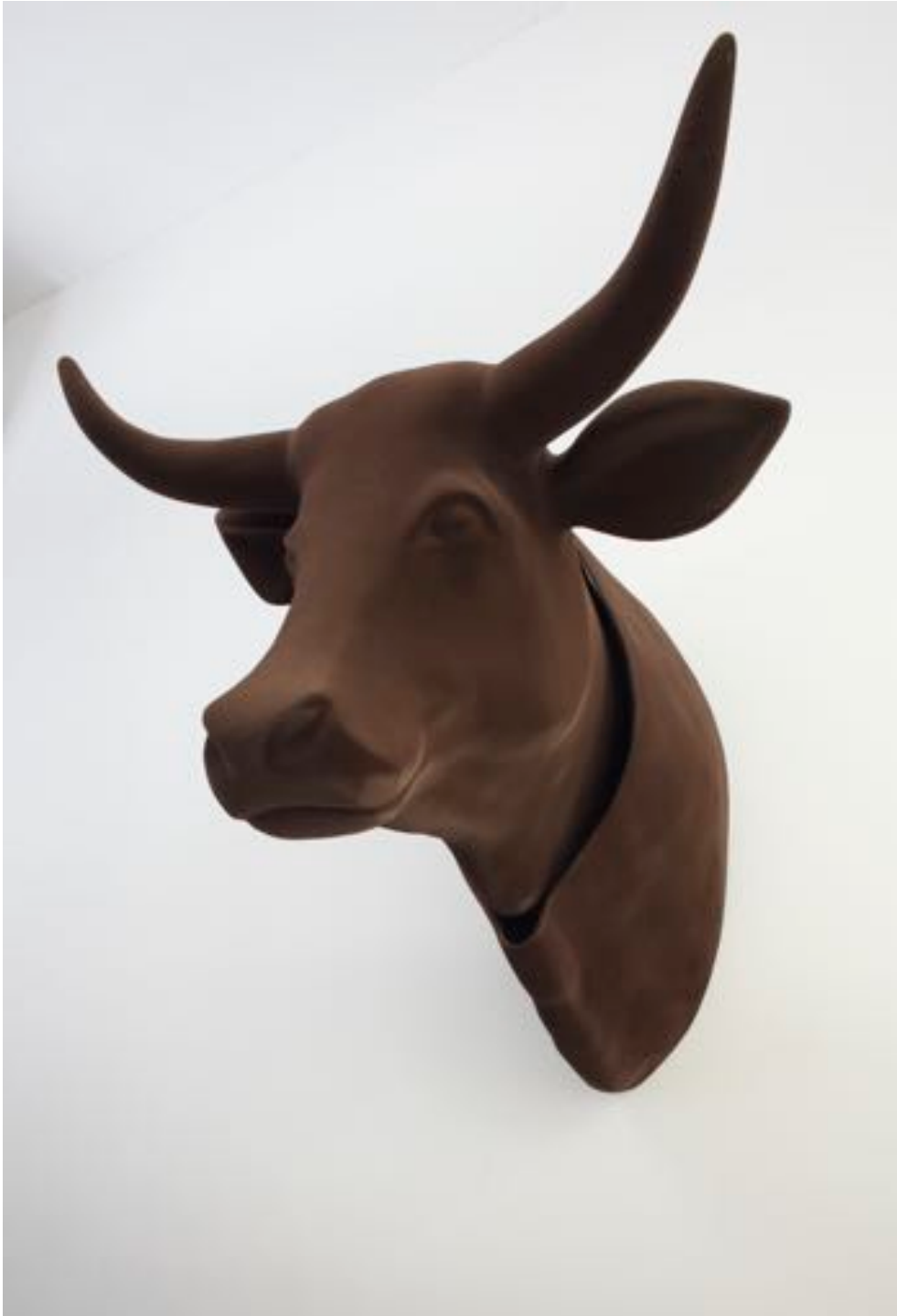
Tête de vache, 2008 resin and flock coating ca. 120 x 80 x 110 cm, unique