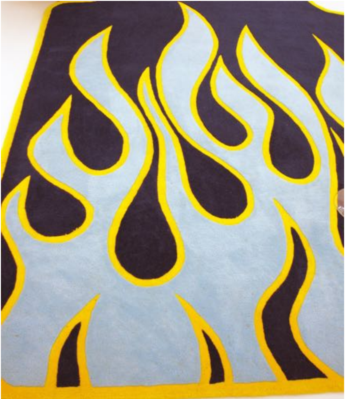
Tapis, 2007 synthetic wool 1,5 x 200 x 300 cm, unique