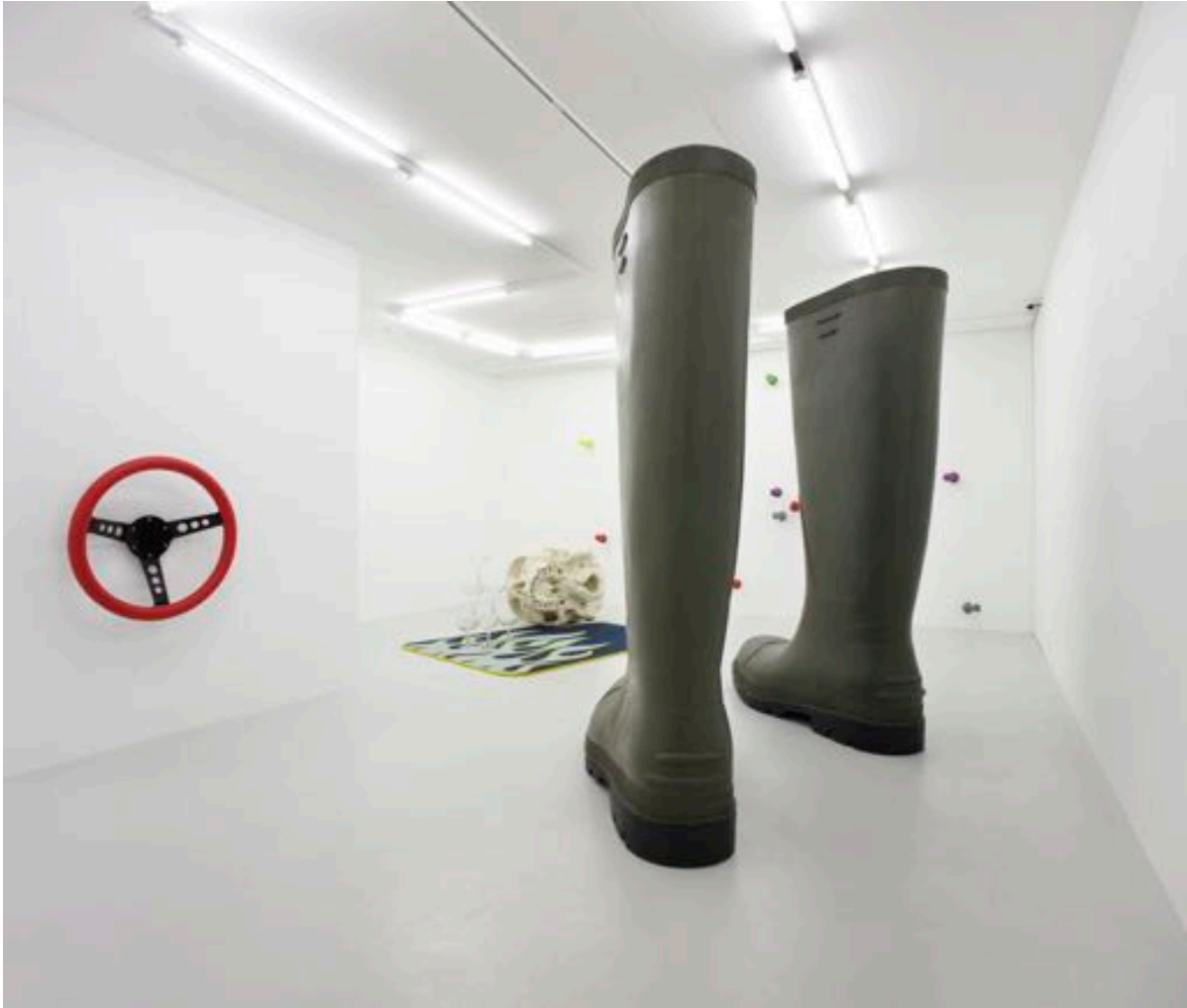
Lilian Bourgeat exhibition view, 2010 Galerie Lange + Pult