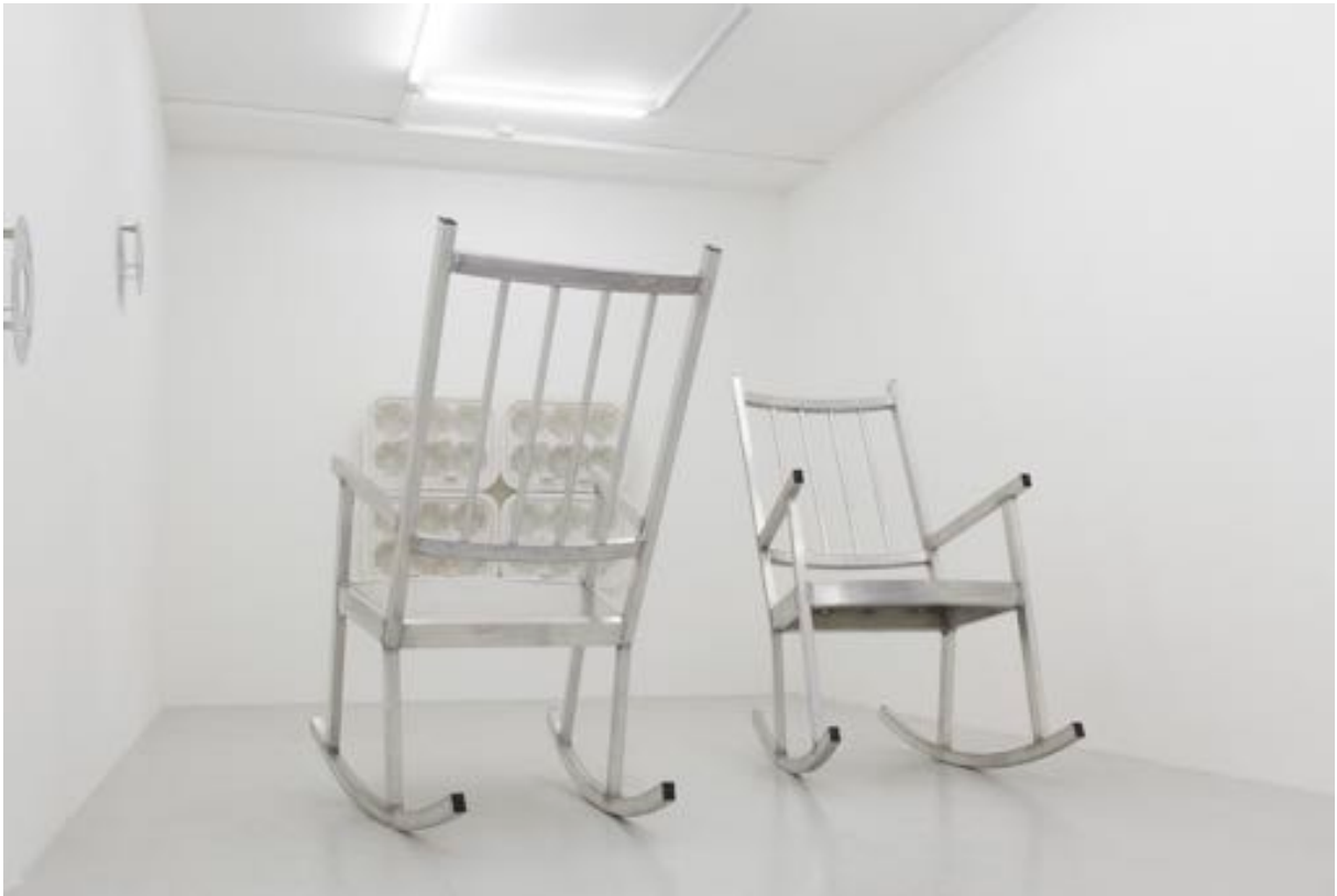
Rocking chairs, 2009 aluminium 190 x 104 x 154 cm, ed. of 20