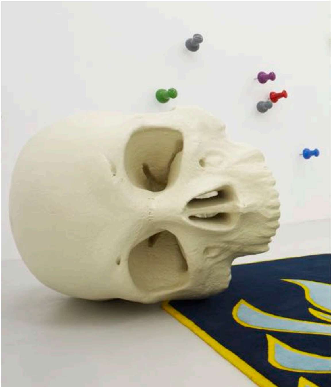
Crâne, 2010 polyester resin 110 x 150 x 100 cm, ed. of 3