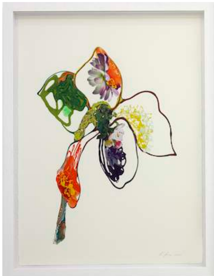
Monsoon Kelly, 2011 Lacquer, acrylic and collage on Aquarelle Arches paper 76 x 58 cm