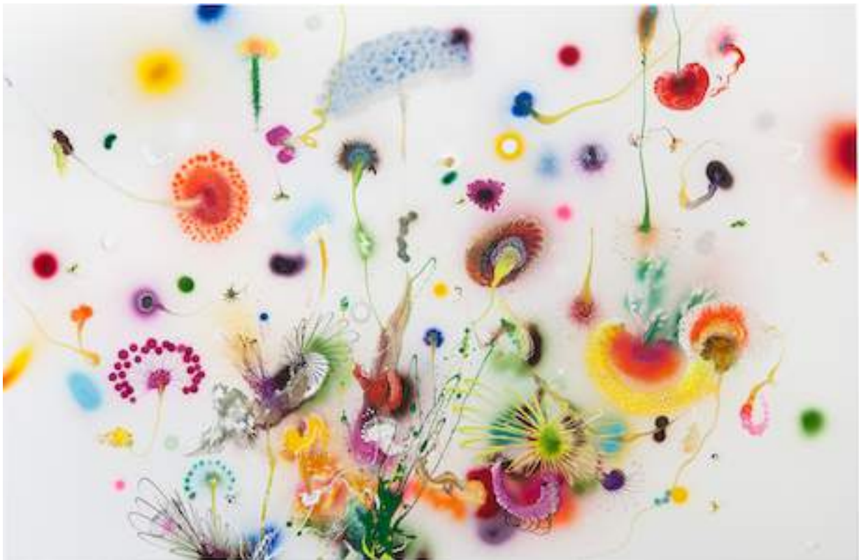
Psychotropical Monoe, 2011 Lacquer and acrylic on canvas 130 x 200 cm