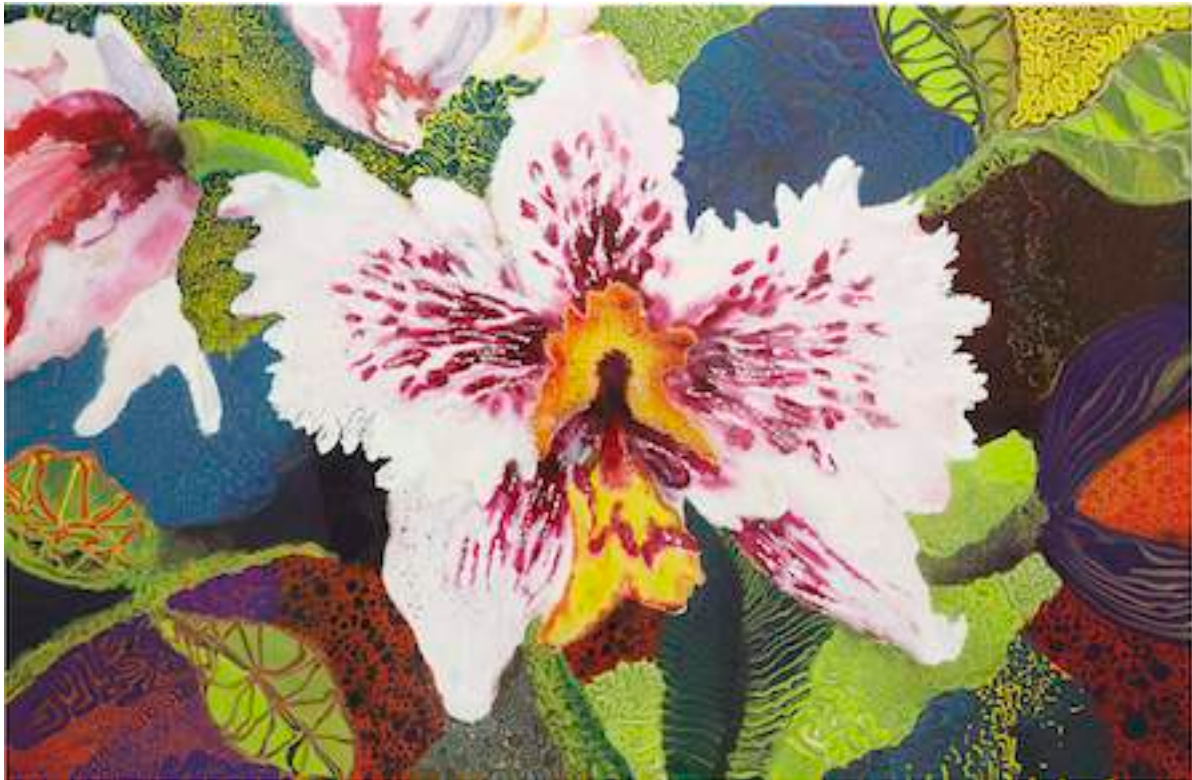
Supernatural Diana, 2011 Lacquer and acrylic on canvas 130 x 200 cm