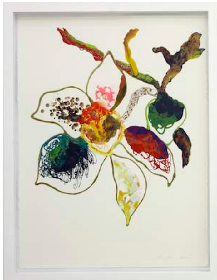
Monsoon Ellis, 2011 Lacquer and acrylic on Aquarelle Arches paper 76 x 58 cm