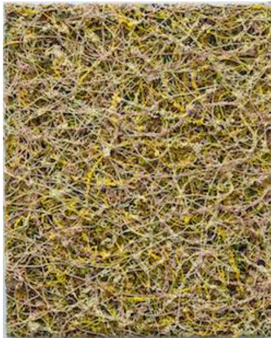
Chromolux Limepink, 2011 Oil on linen 30 x 24 cm