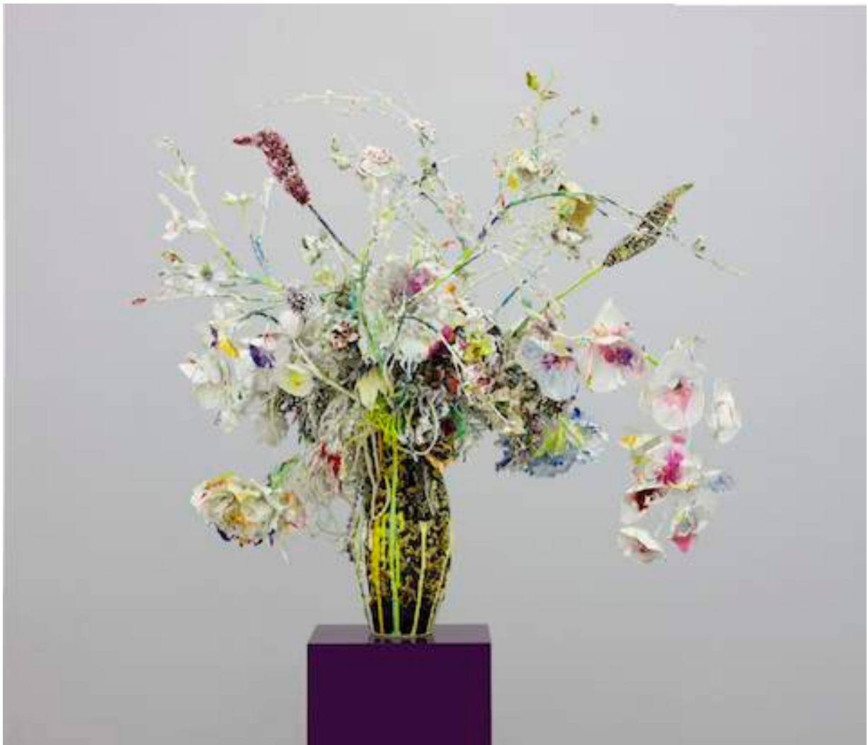
Substrat Caerleon, 2011 Lacquer, acrylic, glitter, collage on mixed media, metal and ceramics 110 x 100 x 120 cm