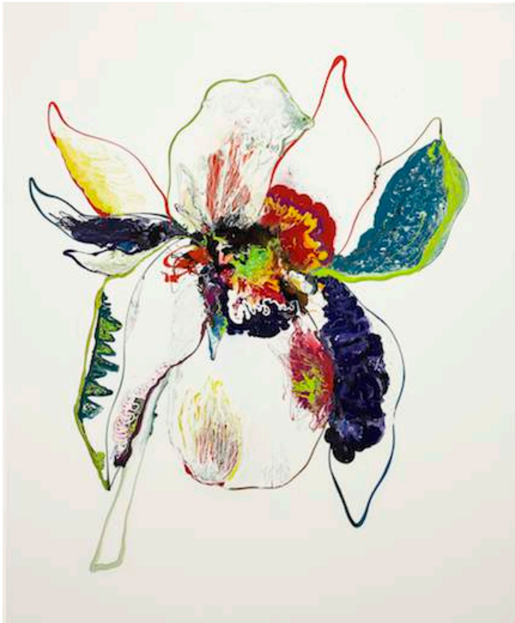
Monsoon Soraya, 2011 Lacquer and acrylic on canvas 170 x 140 cm