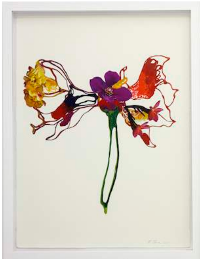
Monsoon Magnol, 2011 Lacquer, acrylic and collage on Aquarelle Arches paper 76 x 58 cm