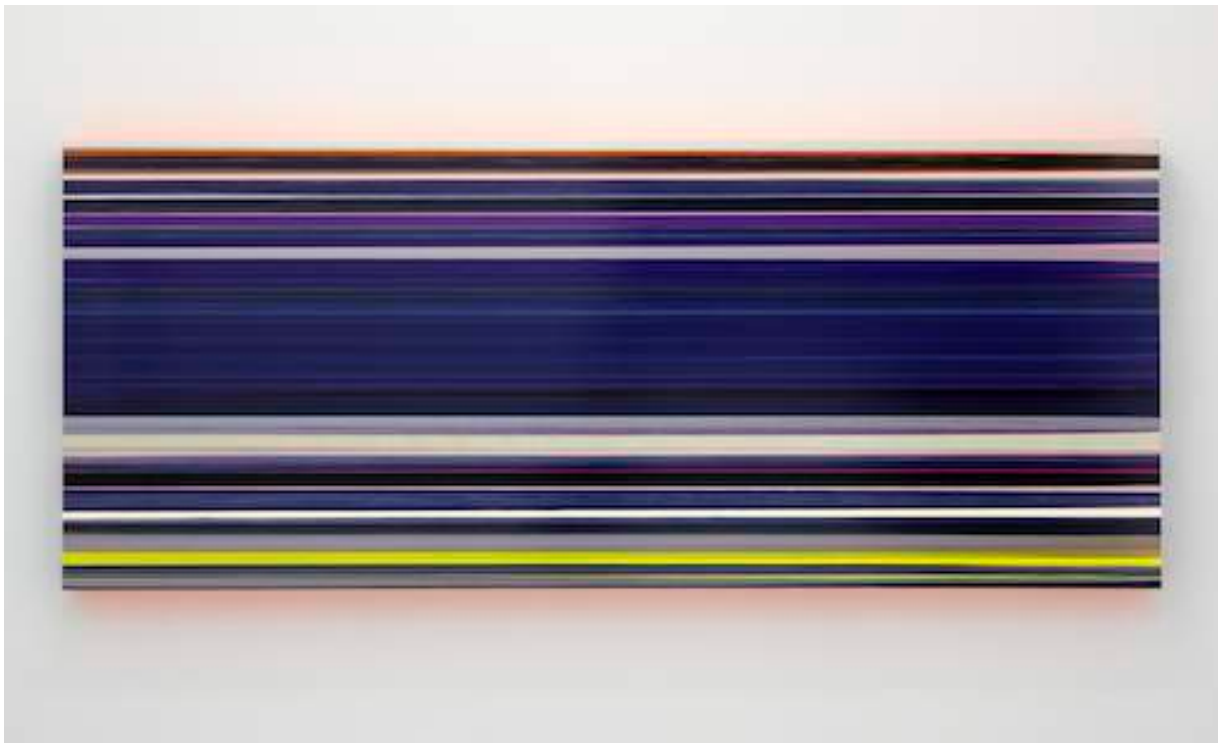
Technicolor Total Panorama Crystal, 2011 Lacquer and acrylic on canvas 110 x 270 x 12 cm