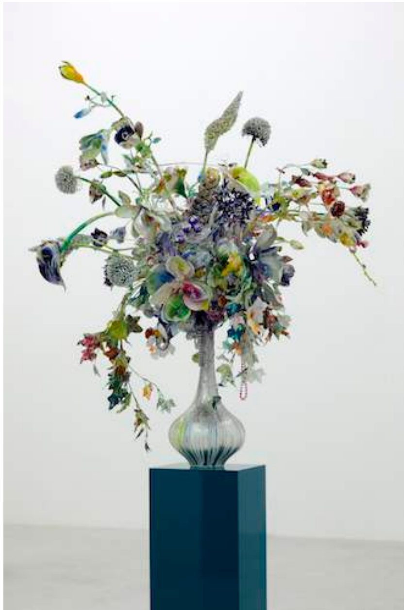
Substrat Mauritius, 2011 Lacquer, acrylic, glitter, collage on mixed media, metal and ceramic 110 x 100 x 105 cm