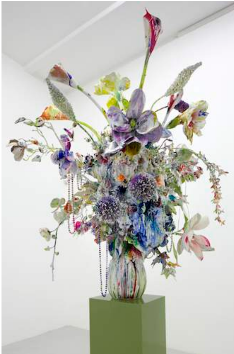
Substrat Helios, 2011 Lacquer, acrylic, glitter, collage, ceramics and metal on mixed media 115 x 100 x 90 cm