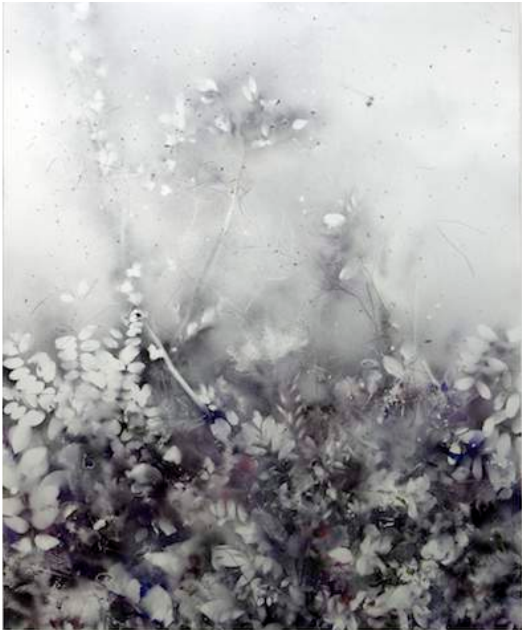
Silver Dust Akadia, 2011 Lacquer, acrylic, collage and mixed media on canvas 170 x 140 cm