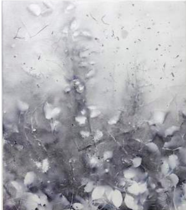
Silver Dust Mangrove, 2011 Lacquer, acrylic, collage and mixed media on canvas 80 x 70 cm