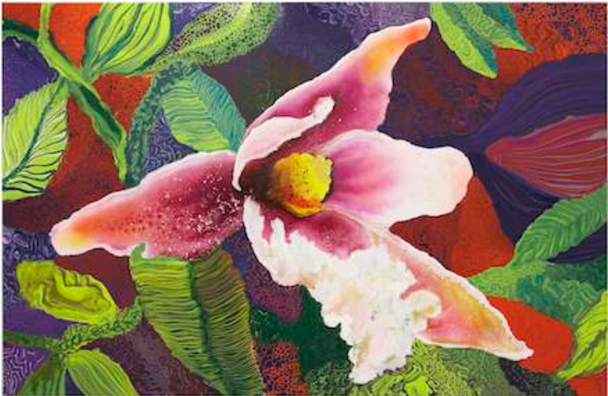
Supernatural Xenia Renaissance, 2011 Lacquer and acrylic on canvas 130 x 200 cm