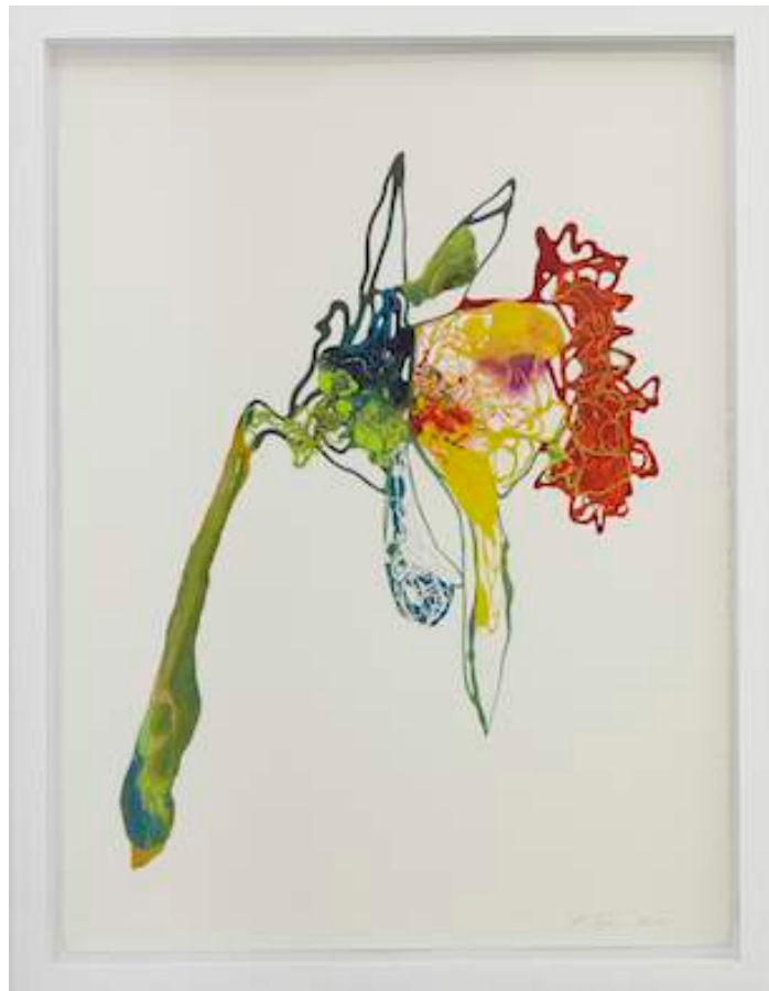
Monsoon Ortis, 2011 Lacquer and acrylic on Aquarelle Arches paper 76 x 58 cm