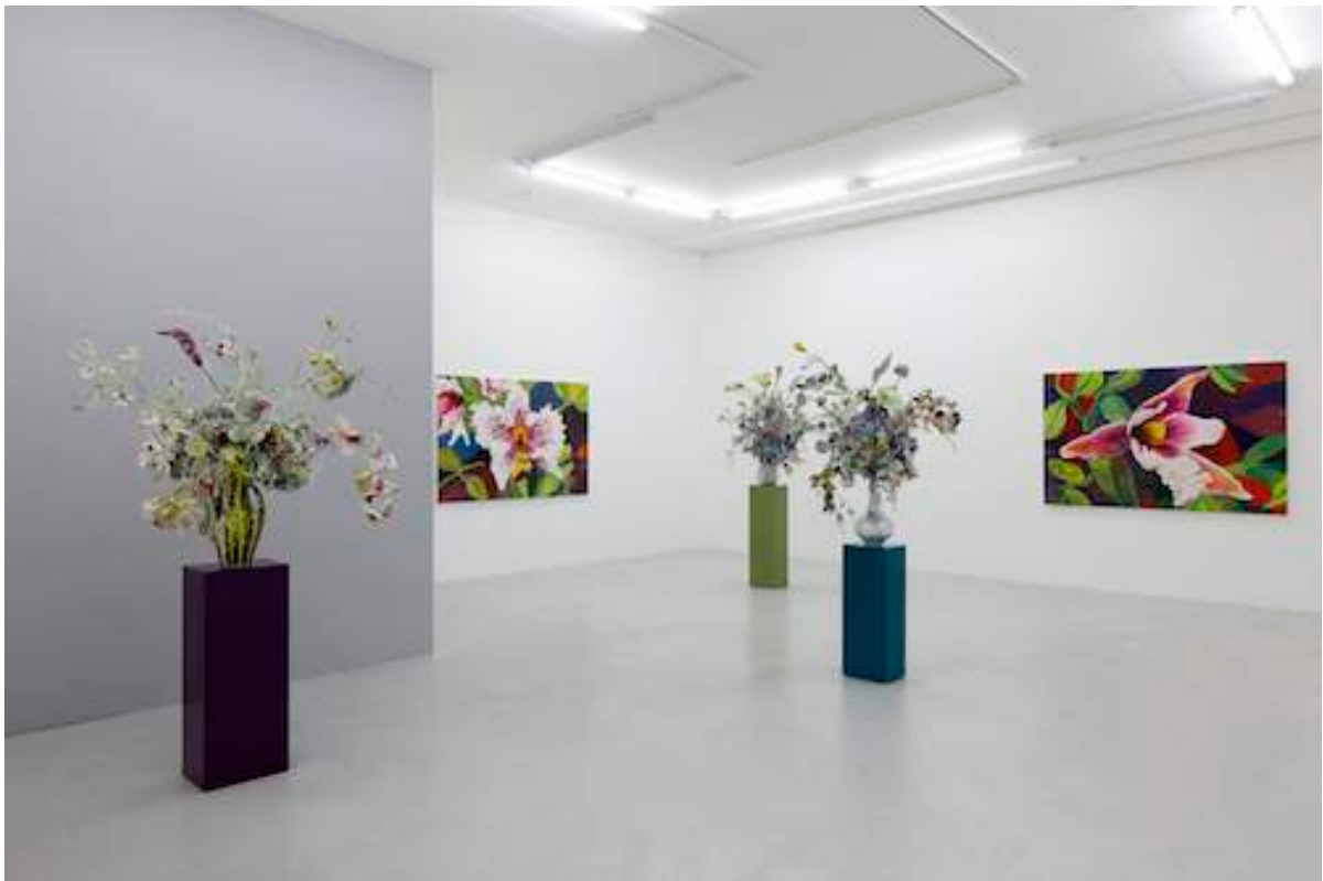
«Sculptures & Paintings» Exhibition view Galerie Lange + Pult