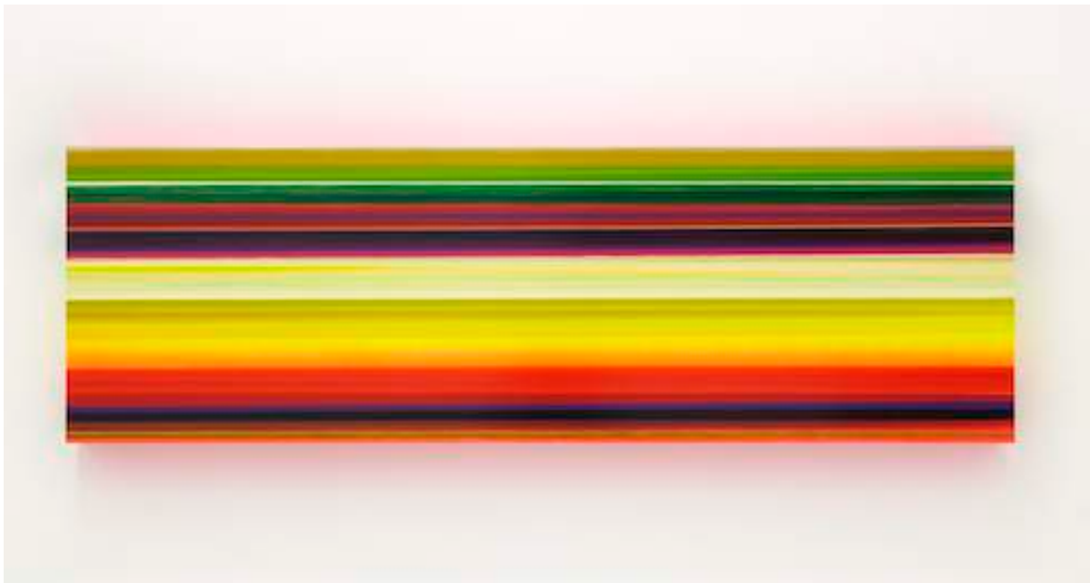
Technicolor Large Panorama Magellan, 2011 Lacquer and acrylic on canvas 70 x 220 x 12 cm